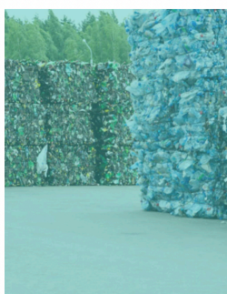
MENÍME ODPAD NA SUROVINU