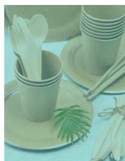
PREDCHÁDZAJ VZNIKU ODPADU