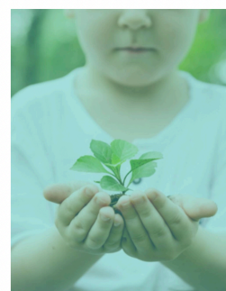
SÚŤAŽE, KVÍZY, HRY