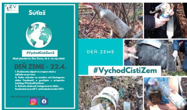
Koláž je zhotovená zo zaslaných fotografií z tejto akcie

Cieľom súťaže bolo podnietiť obyvateľov zapojiť sa do zberu voľne pohodeného odpadu v prírode, ktorého značnú časť tvoria práve odpady z obalov. Súťaž je pokračovaním rovnakého formátu z predchádzajúceho roka a motívom je Deň Zeme.